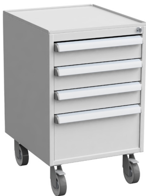
Schubladenblock mit Rollen 60649303