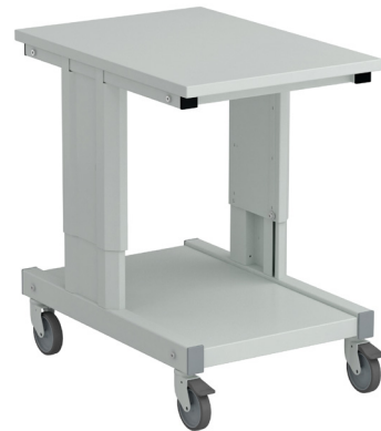
Concept-Wagen in ESD-Ausführung